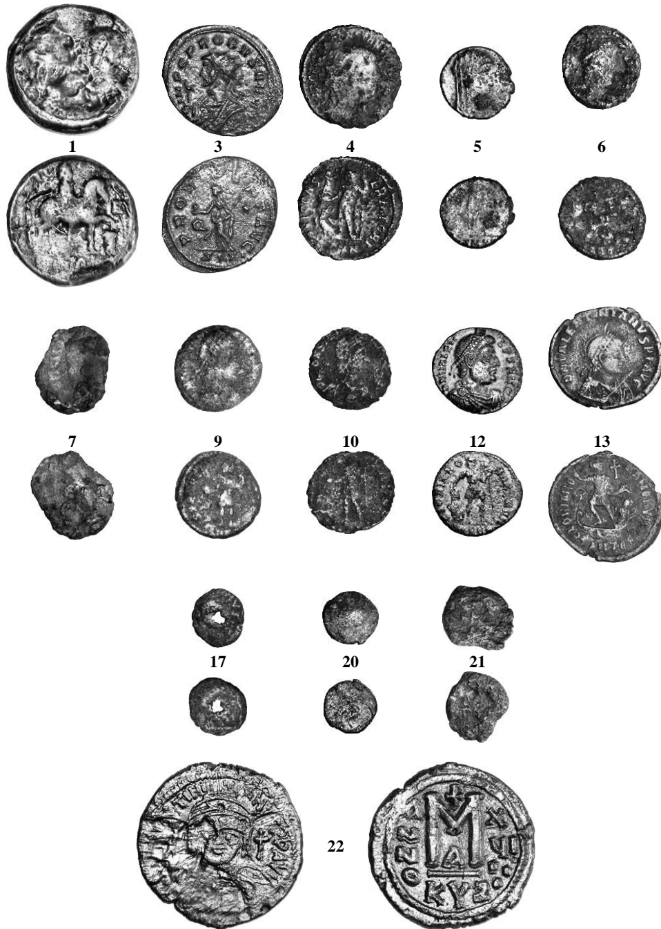
Pl. I - Monede romane și bizantine descoperite în fortificația de la Halmyris